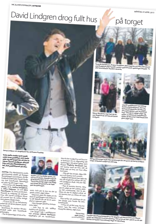
Utdrag ur Ålandstidningen 20 april 2013.

Vid uppföljning bland deltagande företag kunde de uppvisa en rejäl omsättningsökning med 10–200% under evenemangets tre dagar.