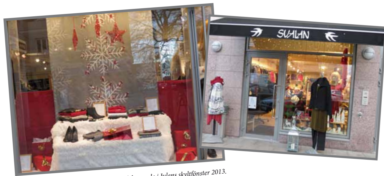
Magiques och Svalans julskyltning efter deltagande i Julens skyltfönster 2013.