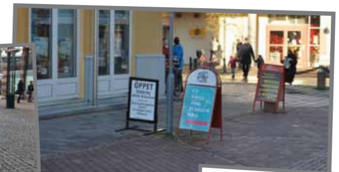
Exempel från Mariehamn