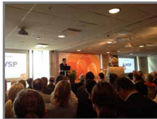
Svenska stadskärnors årskonferens i Visby maj 2013.