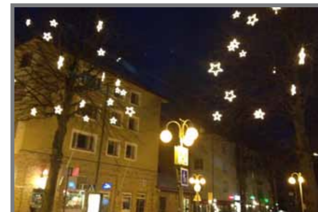
Belysta stjärnträd på julgatan 2013. Ett exempel på projekt som City Mariehamn genomfört med samfinansiering mellan fastighetsägare, Mariehamns stad och City Mariehamn.

För mer projektinfo, utredningar, Handlingsprogram 2012 och Gatuprogram för Mariehamn se www.centrum.ax