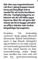
Butiksägare vill ha mer samverkan i stan.

Butiksägare vill ha mer samverkan i stan. Det är viktigt att alla aktörer är med och vill bygga ett centrum som ska bli ett levande centrum. Det är viktigt att alla aktörer är med och vill bygga ett centrum som ska bli ett levande centrum.