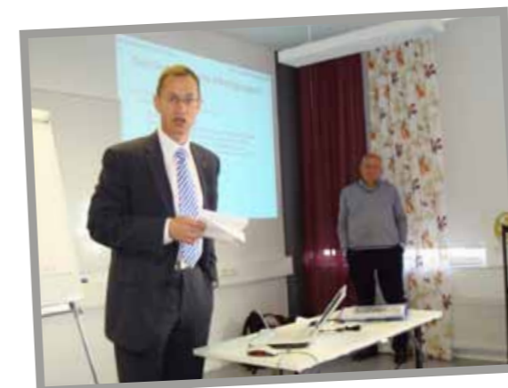
Stadsdirektör Edgar Vickström inledde sin första vardag på posten med att delta i Ett livskraftigt centrums workshop.