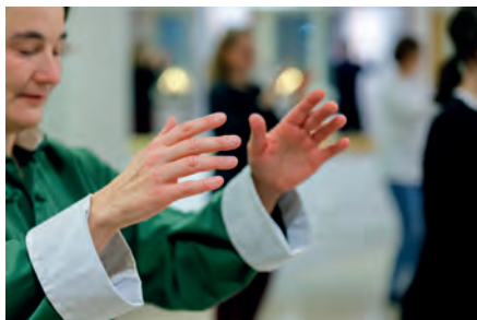
Lugna mjuka rörelser i Tai Chi.