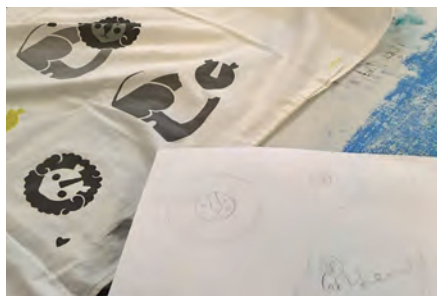
Tygtryck och skiss på motiv.

Ta med skissmaterial, skalpell och provbitar av ljusa tyger i bomull eller linne till första tillfället. Materialkostnad enligt förbrukning faktureras i samband med kursavgiften.