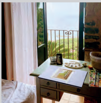
Målarresa, Italien.