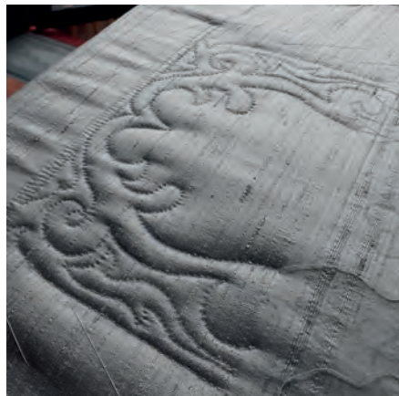
Vaddstickning på sängöverkast.

egen symaskin. Ta även med lunch och fika.