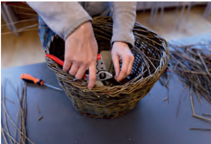
Pilflätning av en korg.

söndag 11:00-17:00 12.3.2023 (1 tillf. 7 lekt.) Sottunga skola Les Husell Kursavgift 35 € Konsten att tillverka rep utvecklades tidigt i människan historia. Man kan göra rep av många olika naturliga fibrer. Vi kommer att använda oss av jute och bomull. Vi slår rep till de ändamål som du väljer t.ex. hundkoppel, hopprep, förtöjningsrep, gardinhängen eller något helt annat. Vi kommer att tillverka rep i alla färger och storlekar. På farmor och farfars tid hade alla båtushområden egna repslagarmaskiner. Det är en tradition som vi behöver vårda. Har du råmaterial som du tror kan bli till rep så ta med det. Ta även med fika. Anmälan till Sottungas kontaktperson, se sid 55.