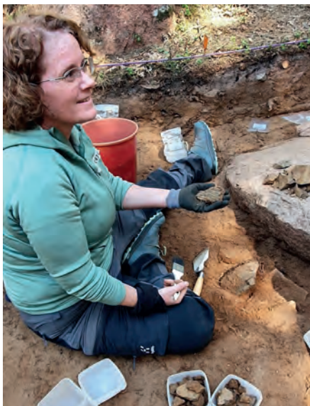
Fynd från utgrävningsplatsen 2022.